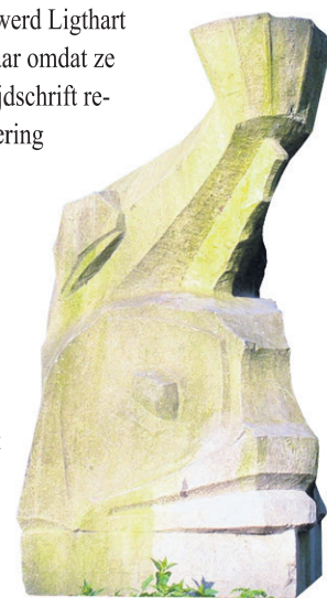
- De Dolphijn die omzwervingen door de stad maakt en die nu te vinden is bij de brug aan de Droogleever Fortuinweg. -