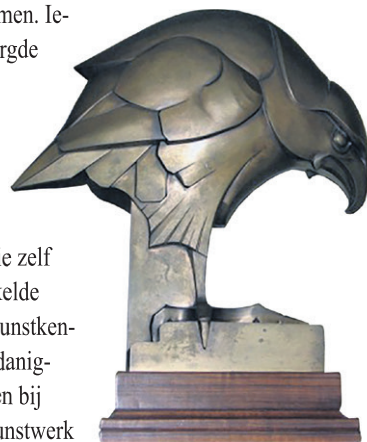
- De visarend door Altorf in de bibliotheek van het jachtslot St. Hubertus op de Hoge Veluwe. -

In 1909 en 1910 werd op het toenmalige Juliana van Stolbergplein in het Bezuidenhout een door de architect J. Limburg ontworpen monument ter ere van de geboorte van prinses Juliana gebouwd. Het meest opvallende aan dit monument zijn een viertal leeuwen die door Altorf - samen met P.F. Ritter - uitgevoerd zijn. Tijdens het bombardement in 1945 is een groot deel van dit plein samen met de omliggende straten verwoest, maar wonder boven wonder bleef het monument redelijk intact. Dit plein lag op de kruising van de Juliana van Stolberglaan en de Adelheidstraat. Omdat dit plein later deel uit zou gaan maken van de Juliana van Stolberglaan zelf, is het monument in 1956 naar het Stuyvesantplein verplaatst.