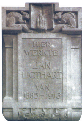
- Gedenksteen, gemaakt voor de gevel van de school in de Tullinghstraat. De steen verhuisde later mee naar de Jan Ligthartschool in de Slicherstraat. -