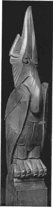
J. ALTORF. Eikenhouten trappaal